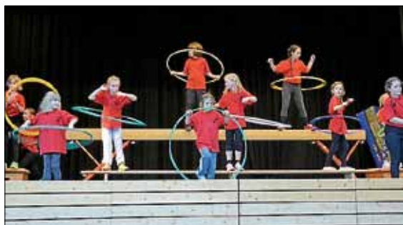
Turnen für Mädchen ab 6 Jahren; hier mit den "sweet girls"

Wir gratulieren nochmals allen Athleten zu ihren Abzeichen und freuen uns schon jetzt auf viele Mitglieder die auch in diesem Jahr ihr Sportabzeichen machen möchten. Ein abwechslungsreiches Programm, überwiegend gestaltet durch die Gruppen der Kinder und Jugendlichen im Verein, sorgte auch in diesem Jahr wieder für eine fröhliche Stimmung.