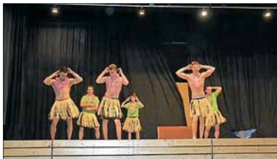
"Die phantastischen Vier" - Turnen für Jungen ab 12 Jahren

Eine solch schöne Feier wäre ohne die vielen Helfer nicht möglich. Trotz einiger Krankheitsfälle waren ausreichend Helfer vor Ort um dort mit anzupacken wo es nötig war. Ein großer Dank geht an alle Übungsleiter, Ausschussmitglieder, Kuchenspender, Helfer und natürlich an unsere Mitglieder und ihre Angehörigen fürs zahlreiche Kommen. Euer TV Pinache