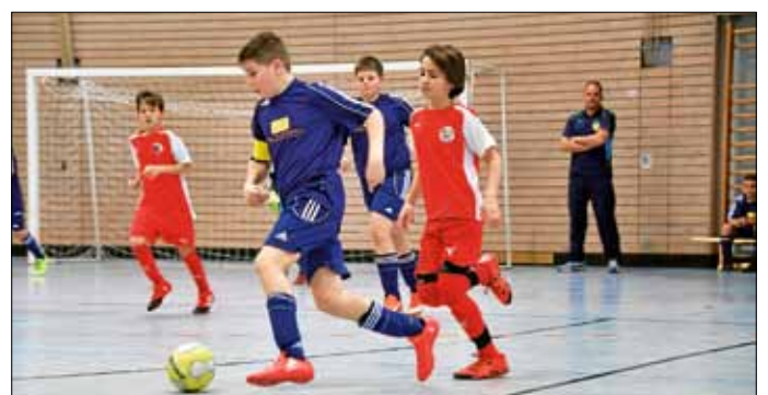
ein harter Kampf gegen Lomersheim