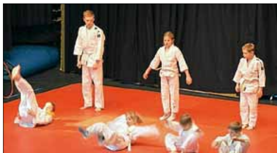
"Slow and fast" - Judo für Jungen und Mädchen