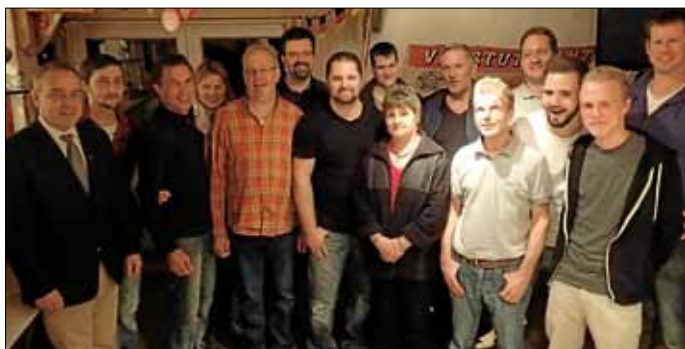
Die Gesamtvorstandschaft der SFG Serres 1993 e.V.