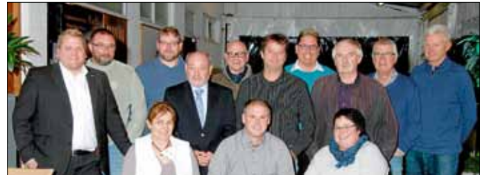
Wir wünschen unseren Mitgliedern und unseren Mitbürgern eine gesegnete Adventszeit, frohe Weihnachten und einen erfolgreichen Jahresausklang!

Wir konnten diesen ereignisreichen emotionalen Abend im geselligen Beisammensein ausklingen lassen.