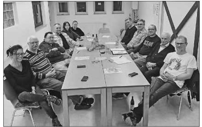
Die Mitglieder und Unterstützer des neu gebildeten Festausschusses beim ersten Treffen zum 150-jährigen Vereinsjubiläum im Jahre 2025