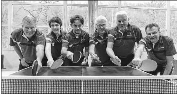
3. Mannschaft beim Spiel gegen den TSV Großglattbach