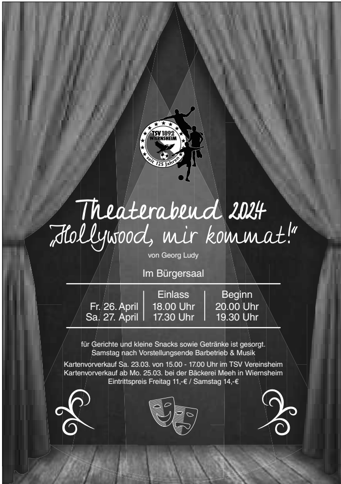
Plakat: TSV Wiernsheim

... für die Unentschlossenen unter euch .. es gibt noch Restkarten für Freitagabend. Am besten gleich die Karte sichern bei Bäckerei Meeh. Am Samstagabend sind alle Karten schon weg .. das freut uns riesig!!! Eure Theatergruppe TSV Wiernsheim